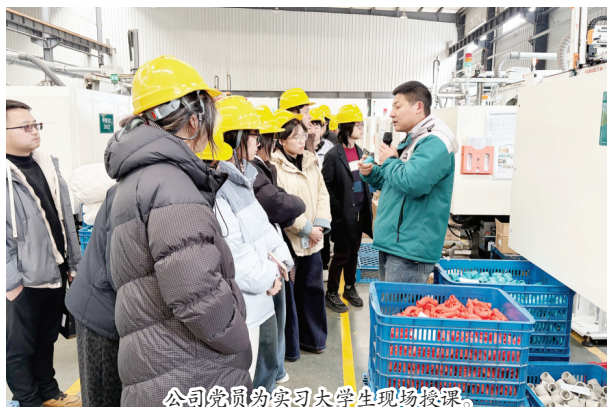
公司党员为实习大学生现场授课。