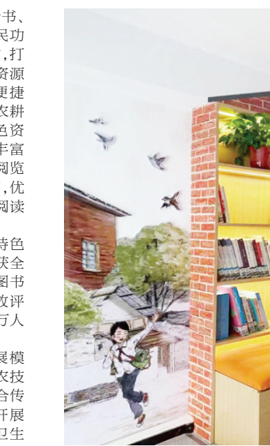
叶集本土作家作品推荐阅读角

紧抓省级农家书屋提质增效试点机遇,叶集区从运营管理、数字赋能、跨界联动多方面持续改革创新,不断健全常态化、可持续运营模式,为农家书屋长久健康发展注入源源不断动力。 推动农家书屋与基层理论宣讲深度融合,嵌入理润新叶微课堂,设立红色读物专区、政策解读阅读角,结合不同人群需求精准开展志愿服务,面向老年人开展乡土故事宣讲,联动洪集镇周末大碗茶暖心服务;面向少年儿童开设绘本剧场、美育课堂;面向青年群体搭建技能交流书友圈,依托便民群众服务平台助力青年成长成才。同时创新将群众阅读参与情况纳入“无事”找书记基层治理、文明银行积分兑换体系,充分调动群众读书学习、参与文化活动的主动性与积极性。 加快全域数字阅读建设,搭建城乡一体化有声阅读矩阵,借助乡村应急广播、公园