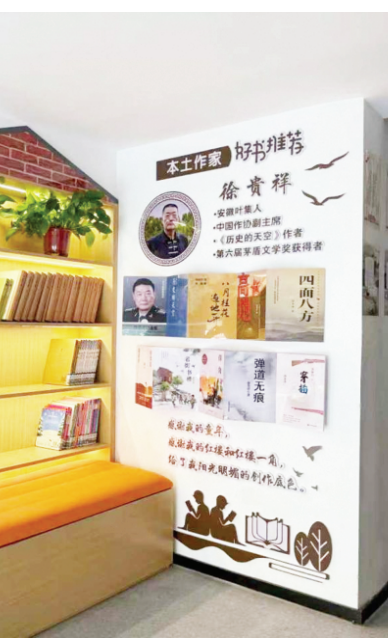
叶集本土作家作品推荐阅读角

叶集区摒弃粗放式管理模式,不断健全管理制度,建强服务队伍,畅通图书流转,构建起保障有力、运转高效、常态长效的农家书屋运营管理服务体系。 健全绩效激励机制,严格落实以奖代补政策,对图书借阅量大、活动开展频繁、特色亮点突出、群众反响好的农家书屋,给予专项运营经费与活动补贴,树立重实干、重实