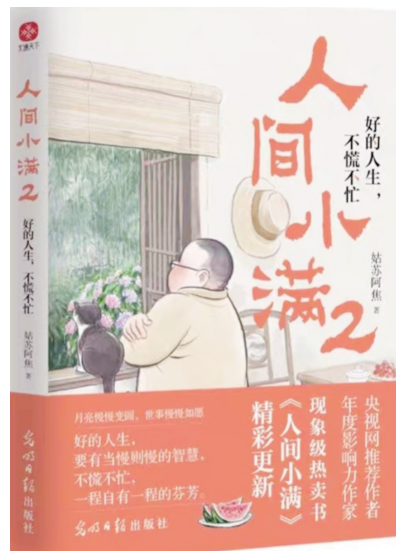
《人间小满2：好的人生，不慌不忙》 姑苏阿焦 著 光明日报出版社

慢度日常，静享清欢，该书让我意识到，圆满不在远方，而就在俯拾皆是日常中。这也是所有渴望在快节奏中寻找宁静的当下人需要的，它提醒我们放慢脚步，感受生活的每一缕芬芳。正如作者所言，“小满，知足坦荡”，这种态度不仅治愈心灵，更赋予我们面对生活的勇气。