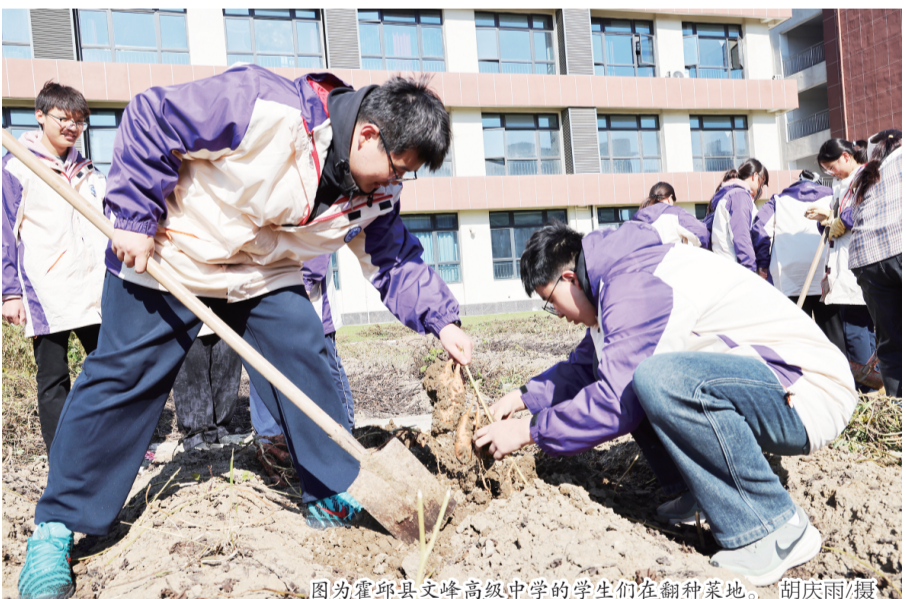
图为霍邱县文峰高级中学的学生们在翻耕菜地。

这场活动，映照出霍邱县以课程标准为纲，以实践基地为依托、“一校一品”的劳动教育推进图景。从县城到乡村，从高中到小学，孩子们正用双手耕耘成长故事。