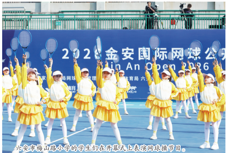
六安市梅山路小学的学生们在开幕式上表演网球操节目。

个国家和地区的3589名中外运动员参赛,从探索起步到品牌深耕,已成为区域极具影响力的国际体育名片。安徽省体育局相关负责人表示,这项赛事是安徽精品赛事典范,十年深耕为安徽体育强省建设注入强劲动力。作为十周年升级之作,本届赛事以ITF女子最高级别W100巡回赛为核心,打造职业与青少年全维度赛事矩阵,采用度假村模式创新办赛。两届赛会女单冠军、第十五届全运会网球项目女单冠军朱琳表示,这是她第四次来到六安参赛,时隔多年归来,感受到球场数量增加、配套设施完善,赛事还为国内青少年选手提供了可以边训练边比赛的优质平台。